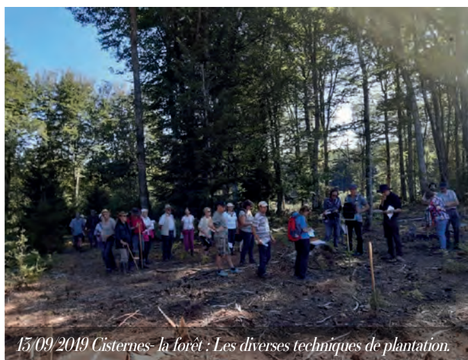
15/09/2019 Cisternes- la forêt : Les diverses techniques de plantation.

Ceci n'est qu'un très bref aperçu de nos actions. Nous vous engageons à retrouver toutes les informations nous concernant sur notre site internet : https://proprietairesforetsdomescombrailles.wordpress.com