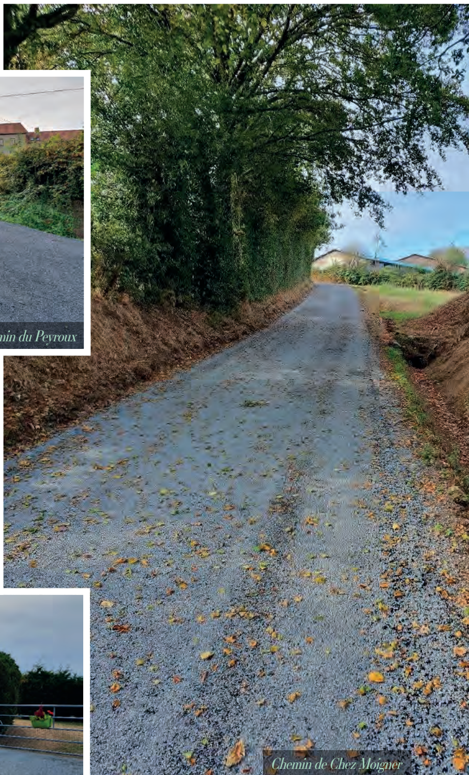
Chemin de Chez Moigner