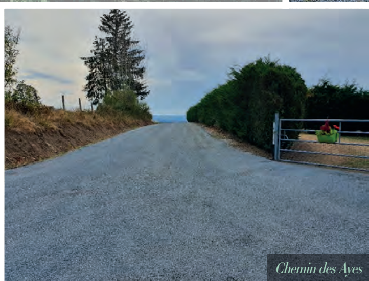
Chemin des Ayes