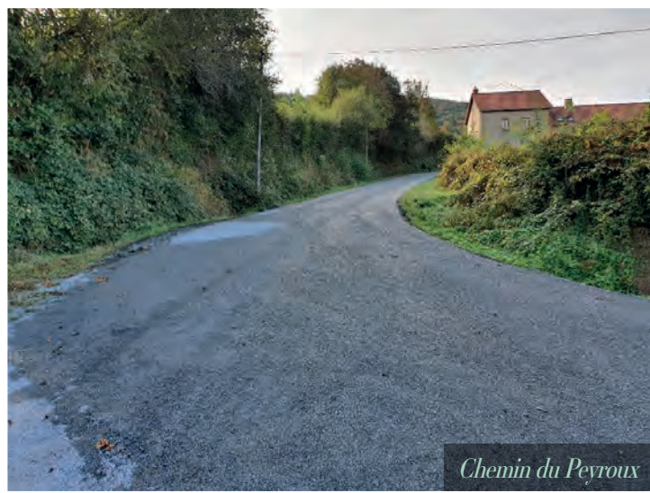
Chemin du Peyroux