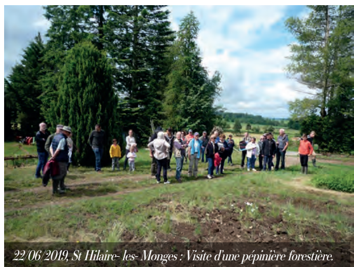
22/06/2019, St Hilaire- les- Monges : Visite d'une pépinière forestière.

Nous nous engageons également dans des actions de communication vers des publics divers. Pour seul exemple, dans le cadre de la journée internationale de la forêt, nous organisons des plantations avec les enfants des écoles, avec le concours des mairies et des enseignants.