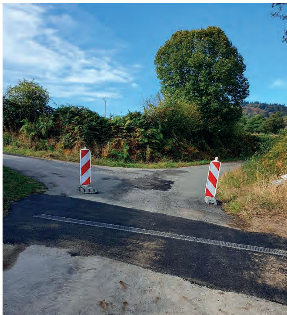
Chemin de Chez Charles