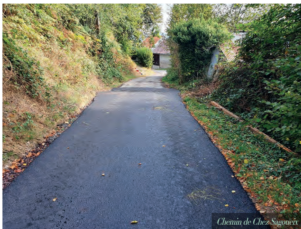
Chemin de Chez Sagoueix